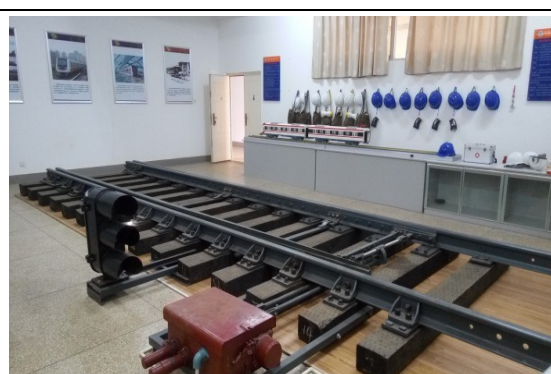
城市轨道交通认知实训室