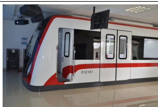
电客车模拟驾驶车厢