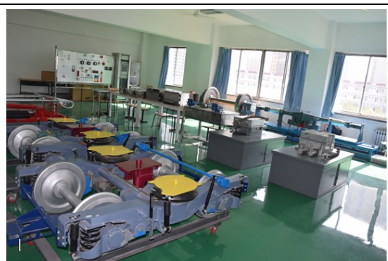
城轨车辆检修实训室