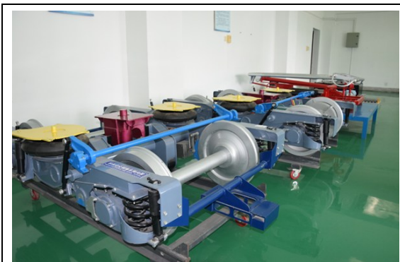
城轨车辆转向架、受电弓拆装实训室