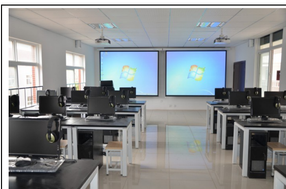
城市轨道交通电子沙盘实训室